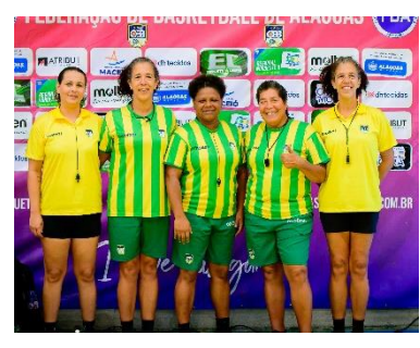
Seletiva Regional 3x3