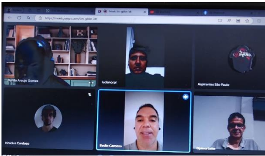
Reunião com a ANB sobre o 3x3