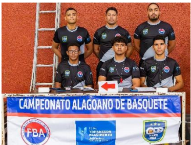
Alagoano 2ª fase