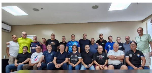
Reunião com presid federação Belém – PA