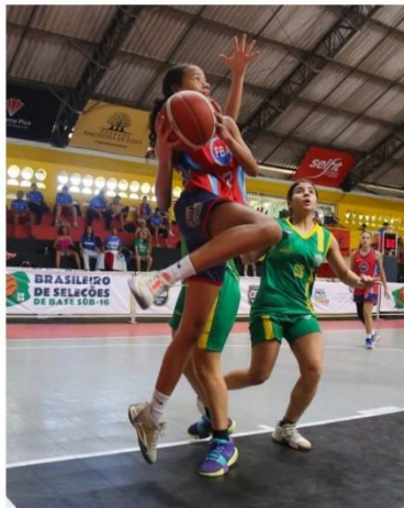
Meninas de Alagoas chegam as semifinais

A Seleção Feminina de Alagoas fez um jogo de muito equilíbrio e de instabilidade. O jogo foi desenhado com Alagoas a frente do placar na maioria do confronto, mas com o Rio Grande do Norte ficando a frente na reta final e Alagoas conseguindo uma virada sensacional nos instantes finais do partida, fechando o placar em 33 x 29, com o primeiro tempo fechando com 17 a 16 para Alagoas. Faltando pouco mais de um minuto, a equipe potiguar venceu por 29 x 25. As alagoanas reagiram, fizeram oito pontos, enquanto as norte-riograndenses não marcaram mais.