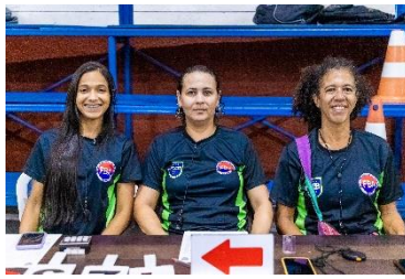
Alagoano 2ª fase