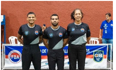
Final Sub 20 Masc