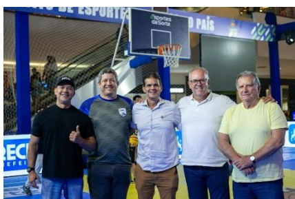
Final Rei da Quadra – Recife

25 DE SETEMBRO – ELEIÇÃO DA CONFEDERAÇÃO BRASILEIRA DE BASKETBALL NO RIO DE JANEIRO