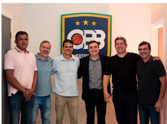
Inauguração sede CBB – Rio de Janeiro