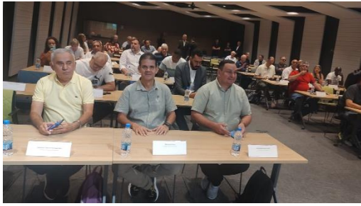
Eleição CBB – Rio de Janeiro