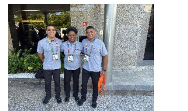
Jogos da Juventude João Pessoa – PB