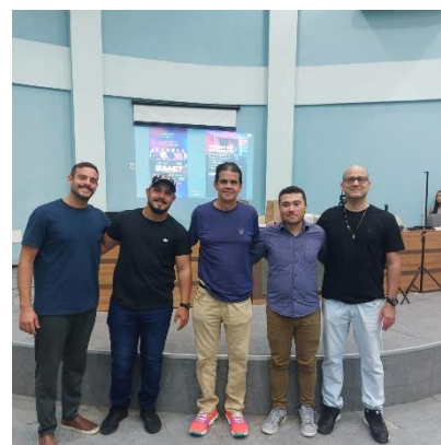
Reunião o curso de Administração da UFAL