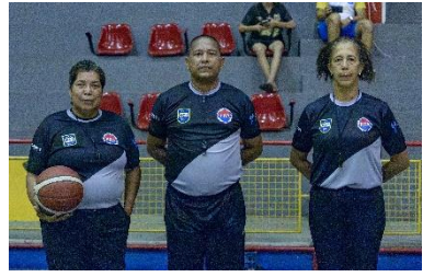
Final Sub 15 Masc