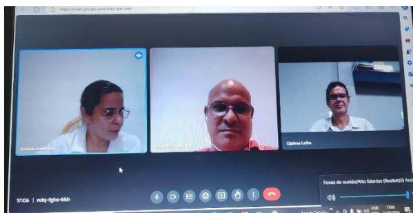
Reunião com a MCS sobre 1x1