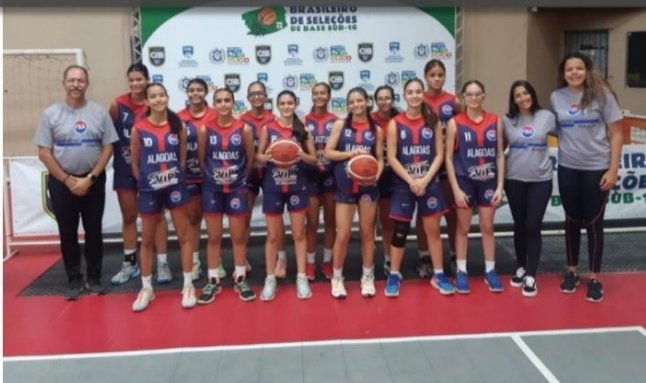
Seleção Feminina foi derrotada e disputará o bronze no Brasileiro Sub16

Utilizamos cookies essenciais e tecnologias semelhantes de acordo com a nossa Política de Privacidade e, ao continuar navegando, você concorda com estas condições.