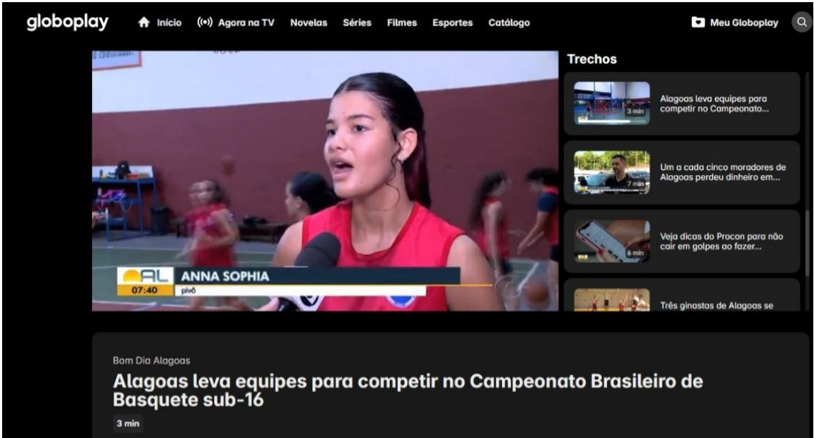
Programa Bom Dia Alagoas (TV Gazeta/Globo)