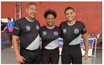
Final Adulto Masc