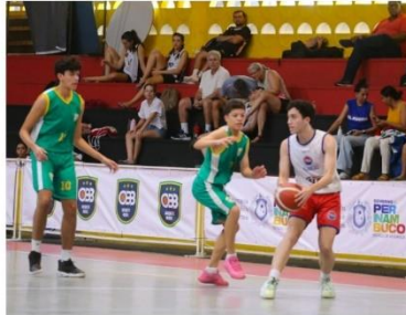
Alagoas (branco) vence o Rio Grande do Norte está na semifinal

É curioso, mas na estreia do Campeonato Brasileiro de Seleções Sub16 masculino e feminino, Alagoas venceu o Rio Grande do Norte e se garantiu nas semifinais da competição.