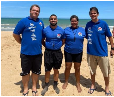
Basquete de Areia