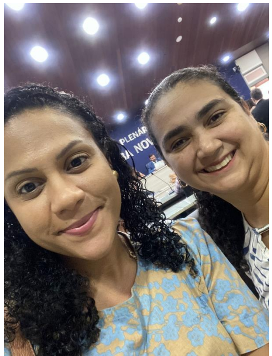
Sessão da Câmara Municipal para aprovação da LOA