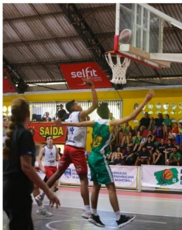
Alagoas se impõe e assegura vitória que levou a semifinal

No masculino, Alagoas foi dominante. Igualdade apenas no primeiro quarto quando empataram em 17 pontos. No segundo quarto, Alagoas abriu seis pontos, fazendo 27 a 21, no terceiro, a vantagem foi ampliada para 43 x 33 e finalmente fechando o placar em 52 x 45.