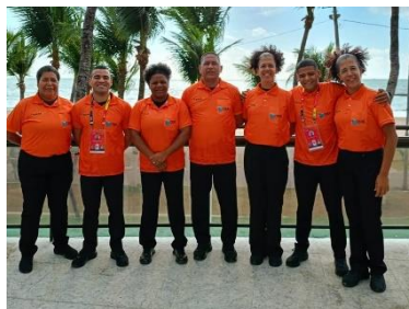
Jogos Escolares Brasileiros Recife - PE