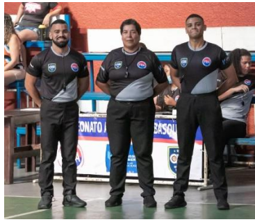
Alagoano 1ª fase